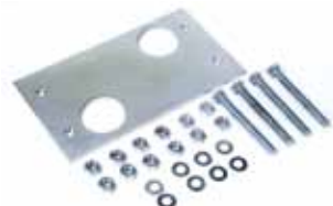
Funderingsplaat met zijdelingse en hoogteregeling