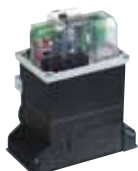
Motorsturing 780 D technische specificaties zie p. 191