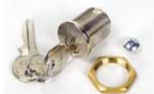
Ontgrendelingslot met gepersonaliseerde sleutel van nr.1 tot nr. 36