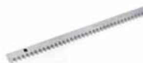
Pakket verzinkte tandlat M4, 30x12 (voor zware schuifpoorten), 4 secties van 1 m. met bevestigingsschroeven