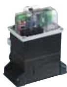
Motorsturing 780 D Technische specificaties zie p. 191