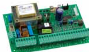
Motorsturing 462 DF Technische specificaties zie p. 188