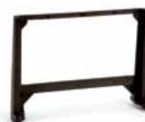
Kit voor inbouw stuurprint in 844