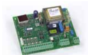
Motorsturing 578 D (installatie op afstand) Technische specificaties zie p. 191